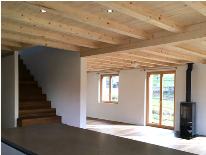
EFH Häfliger, Grünenmatt